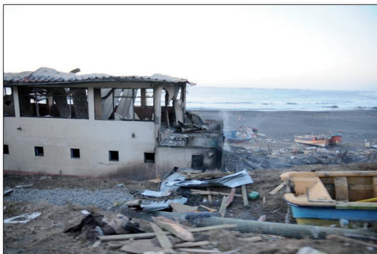
Figura 3: Daños en el borde costero de la Región del Maule.

En la ciudad de Constitución, la gran mayoría de las edificaciones resultaron dañadas por el terremoto y un gran número de ellas quedaron destruidas o en condiciones de no habitabilidad. La zona costera de la ciudad y de la ribera del río Maule fue totalmente destruida por los efectos del tsunami y la subida del nivel del río; llegando las aguas a poca distancia de la Plaza de Armas. En Talca, las construcciones de adobe sufrieron grandes daños, especialmente en el centro histórico y sus barrios adyacentes. La mayoría de las construcciones de uno o dos pisos estaban destruidas o dañadas, aunque los edificios nuevos se encuentran en buen estado. Los accesos a la ciudad están en buenas condiciones, pero muchas calles del casco urbano han requerido reparación.