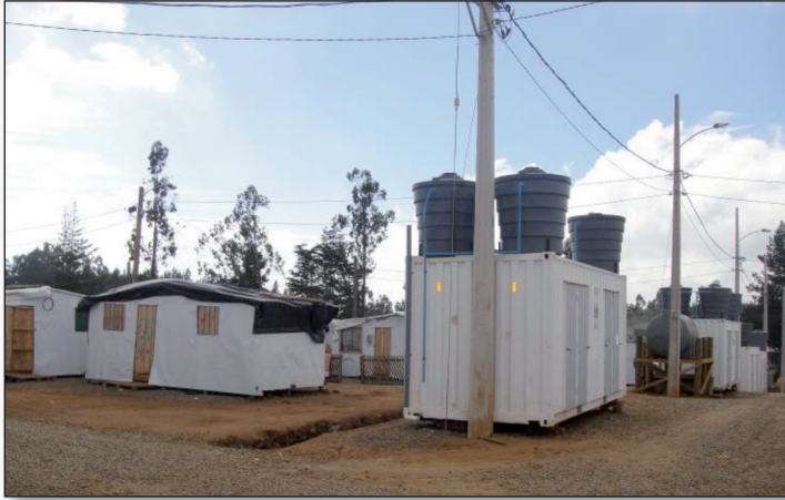
Figura 5. Aldea Puertas Verdes. Constitución. Región del Maule_

Aún cuando gran parte de estas medidas ya se han ejecutado, persisten dificultades con la puesta en operación de las baterías sanitarias ( duchas y baños) en algunas aldeas de Coronel y Lota, debido a que los municipios se han retrasado en la obras de habilitación de la red de alcantarillado. Al mismo tiempo, se estima que las soluciones habitacionales definitivas demorarán al menos dos años.