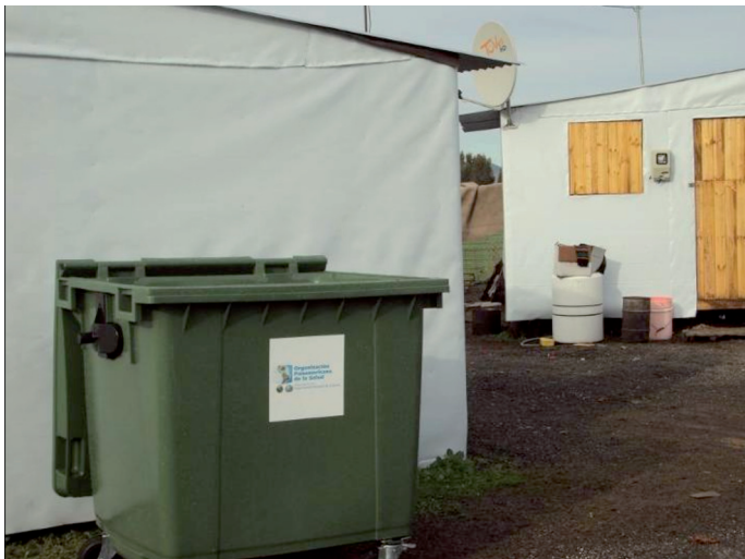
Figura 11. Contenedores de basura. Aldea La esperanza. Región de O'higgins.

Por otra parte, se complementaron las acciones de saneamiento en las zonas afectadas por el desastre, con la entrega de 10 letrinas para el Maule y 42 para Bío Bío para atender a 3.045 personas en aldeas.