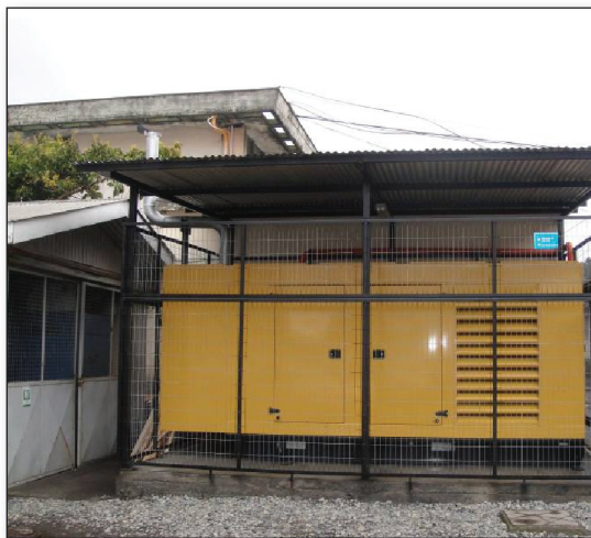
Figura 13. Grupo electrógeno. Hospital Las Higueras. Talcahuano. Región del Bio Bio.

La OPS/OMS adquirió e instaló grupos electrógenos en once hospitales y dos establecimientos de atención primaria, de los cuales 6 están en Bío Bío, 5 en Maule, 1 en Valparaíso y 1 en la Región Metropolitana. Estos equipos industriales fueron de diferentes capacidades, desde 40 Kva. a 300 Kva. para hospitales de alta complejidad, lo cual facilitará la operación de los servicios críticos, esterilización, lavandería, cadena de frío y de otras áreas importantes para asegurar la continuidad del abastecimiento de energía eléctrica a establecimientos que atienden a más de 2.8 millones de personas.