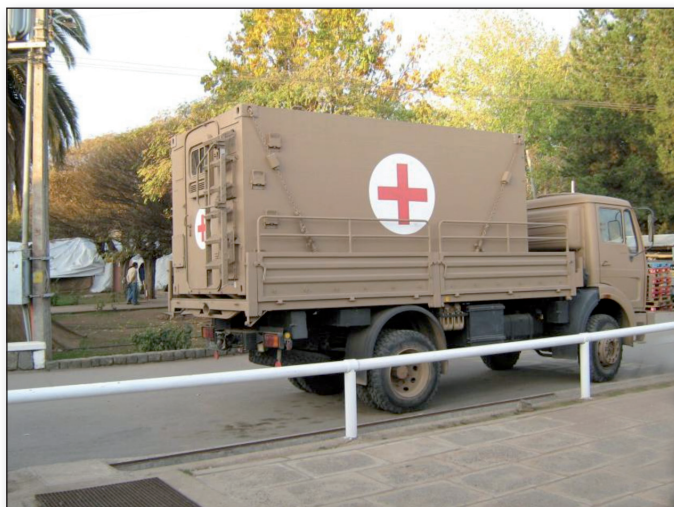
Figura 7. Transporte del Ejército Chileno. Cauquenes. Región del Maule

Una necesidad que aparece desde el primer momento es contar con profesionales de salud con experiencia en la atención a desastres y con equipos para apoyar la respuesta local, tanto en los centros de atención como en las SEREMIS. Las acciones incluyeron el desplazamiento de profesionales de distintas direcciones del Ministerio –como epidemiología, salud ambiental y equipamiento- y la designación en terreno de profesionales con experiencia en desastres; en Bío Bío, por ejemplo, la SEREMIS pidió contar con un médico clínico con esta experticia que pudiera moverse a las distintas áreas de la región –particularmente a aquellas sobre las que no se contaba con información- para orientar a los servicios de salud y establecer las necesidades para atender a la población; recurso que estuvo disponible la primera semana. Para efectos de reforzar a los equipos locales, también la primera semana, se desplazaron 80 personas -personal paramédico y estudiantes de medicina y enfermería- a O'Higgins, Maule y Bío Bío. Este personal fue informado de los elementos personales que debían transportar de manera que su estadía fuera, en el mayor grado posible, auto sustentable.