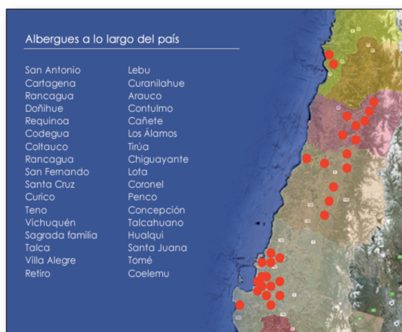
Figura 4. Ubicación de los albergues.