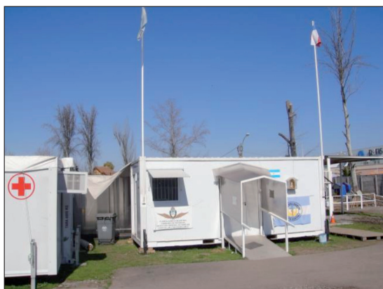
Figura 9. Hospital de campaña Argentino. Curicó. Región del Maule

El Ministerio de Salud diseñó un Plan de Reconstrucción y constituyó un equipo para la coordinación del proceso bajo la supervisión de la Subsecretaría de Redes Asistenciales. Se estructuró un plan de trabajo en tres etapas, con un tiempo determinado para la implementación de cada una de ellas: emergencia inmediata, emergencia invernal y reconstrucción hospitalaria.