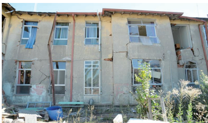
Figura 8. Hospital de Parral. Región del Maule

Los mayores daños en la infraestructura hospitalaria están radicados en Maule donde hubo pérdida total de edificios, como el caso del Servicio de Salud y de la capacidad de hospitalización de cinco hospitales de mayor complejidad. En Concepción, el edificio del Servicio de Salud fue declarado inhabitable y la Torre del Hospital Regional Guillermo Gran Benavente quedó sin funcionalidad; los/as pacientes fueron trasladados al Monoblock y al Centro de Atención Ambulatoria (CAA), que hasta la actualidad permiten dar respuesta a las necesidades de hospitalización de personas. En Arauco, el hospital de Curanilahue sufrió daños que no permitieron la operación durante el mes de marzo de los servicios de hospitalización; en Talcahuano, los daños en instalaciones de esterilización y calderas disminuyeron la capacidad operativa. En todos los casos, se habilitó rápidamente la hospitalización transitoria en otros lugares.