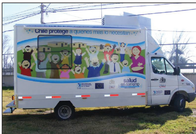
Figura 13. Vacunatorio móvil entregado al Ministerio de Salud.

En el componente de medicamentos para la emergencia, se entregó a los servicios de salud de Arauco, Bío Bío, Concepción, Maule, Ñuble y Talcahuano, tres tipos diferentes de medicamentos para las infecciones respiratorias agudas con la finalidad de reforzar por un mes la disponibilidad de estos fármacos en el stock de los establecimientos.