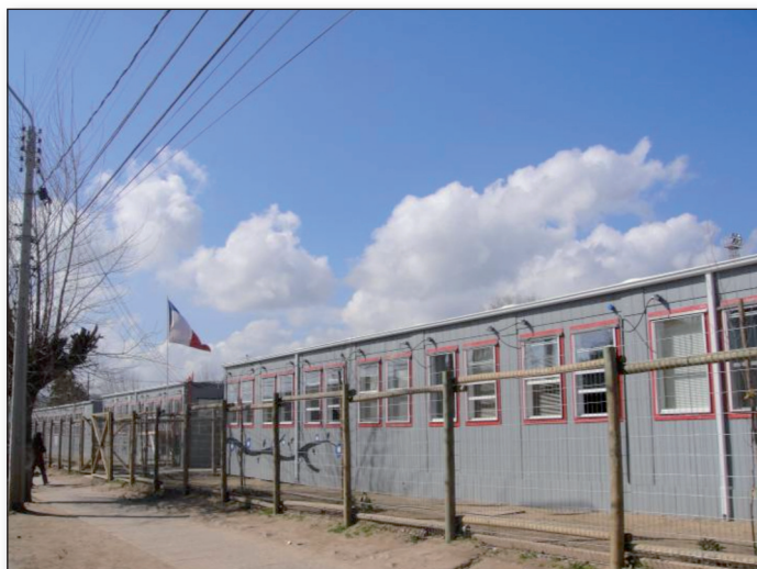
Figura 6. Escuela modular. Ciudad de Constitución. Región del Maule.

El presupuesto de emergencia ascendió a 100 millones de dólares, y lo requerido para la reconstrucción de 125 escuelas y liceos así como la reparación de otros 250 con daños mayores se estimó en 1000 millones de dólares. 35