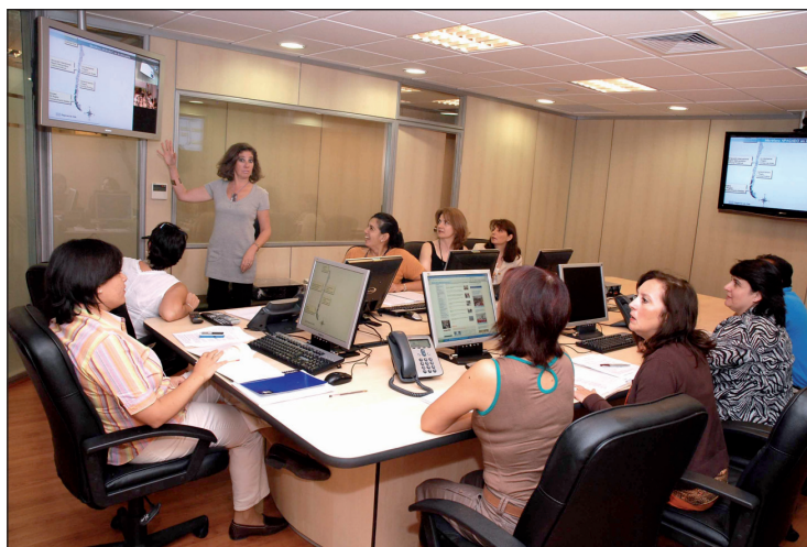
Figura 10. Centro Nacional de Enlace. Ministerio de Salud.

Para efectos de la vigilancia ambiental, en ambas regiones la unidad de epidemiología trabajó coordinadamente con el personal de acción sanitaria, desarrollando labores de acopio de información, fiscalización de condiciones sanitarias, y recepción y distribución de la ayuda.