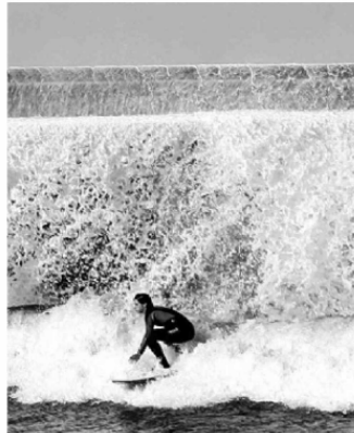
Un surfista se atreve con las olas, al abrigo del muelle de Pientzia.

Los meteorólogos no recuerdan una borrasca así aquí, por lo que será “histórica”